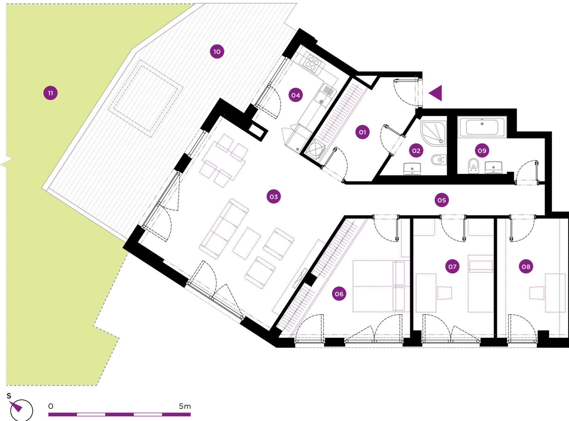
pozice jednotky na patře